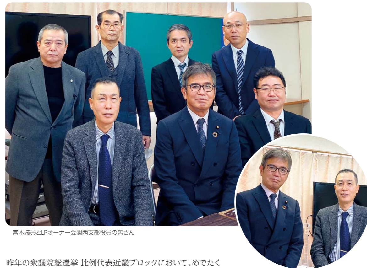
宮本議員とLPオーナー会関西支部役員の皆さん