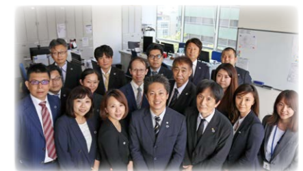
名古屋事務所スタッフ一同

年間850件以上の相続関連案件を手掛けるフジ総合グループの名古屋事務所所長。世界60か国以上を4年半かけて旅をした経験を持つ元旅人税理士。その旅の中で身に染み込ませた「一期一会の出会い」を大事に人との繋がりを縁を大切に、誠実な対応で地主からの信頼が厚い。